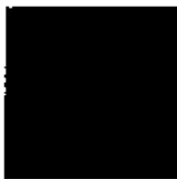
Pantone 484 C