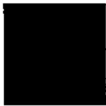
Pantone 484 C