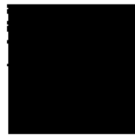
Pantone 3005 C